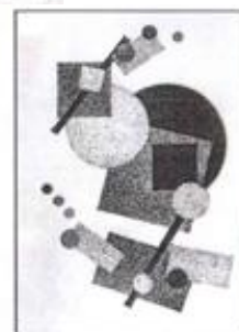
Формальная композиция в технике аппликации под девизом: а – статика, б – динамика