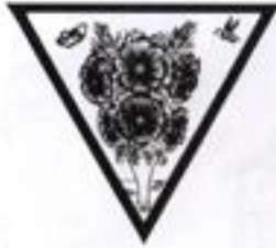
Образная композиция на тему: а – музыка, б – морское дно, в – комнатное растение