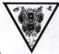
Образная композиция на тему: а – музыка, б – морское дно, в – комнатное растение